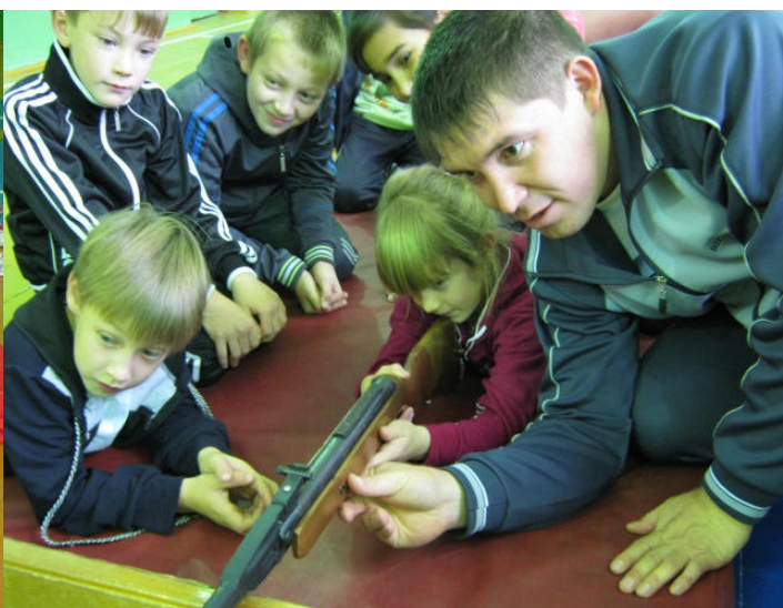
Стрельба из пневматической винтовки