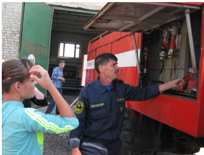
Экскурсия в пожарную часть