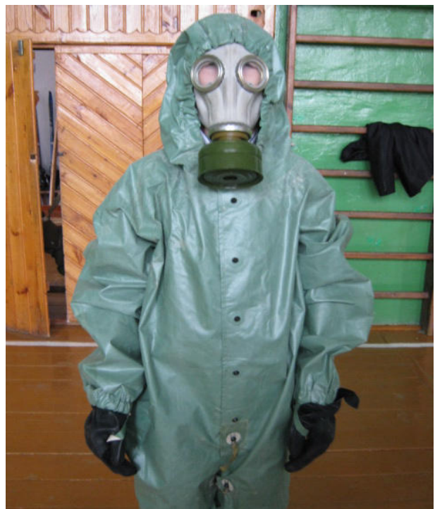
Занятия по применению средств индивидуальной защиты