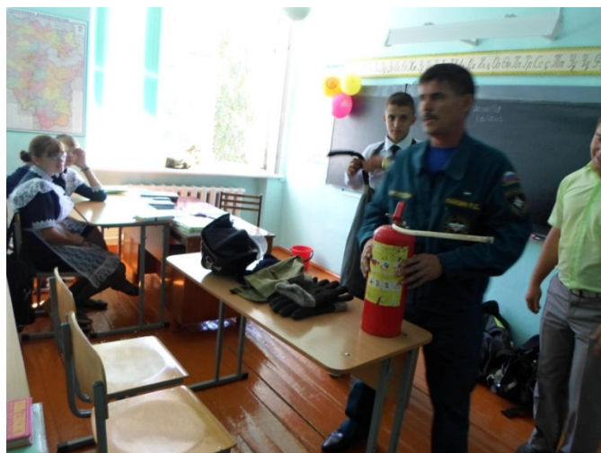
Открытый урок по ОБЖ